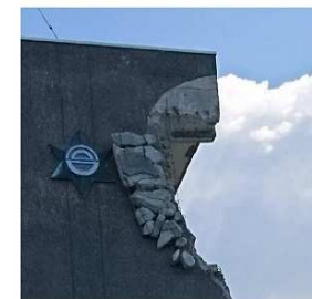
気仙沼向洋高校 向上がぶつかって壊れた壁面に破片がついたままにしている