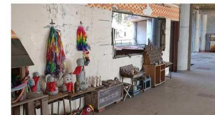
大川小多目的ホール (誰も見れない)