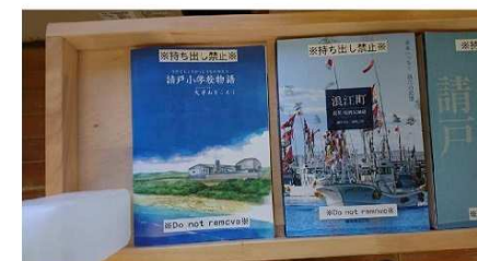
書架の有効活用を