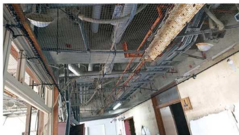
請戸小学校（浪江町）の天井