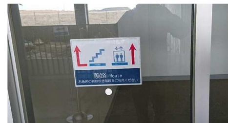
請戸小学校（浪江町）