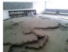
大川小学校 2階教室の床、天井の波状痕