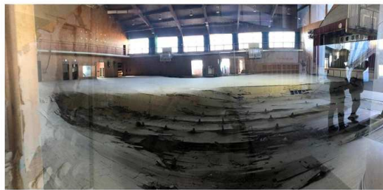
請戸小学校（浪江町）の体育館