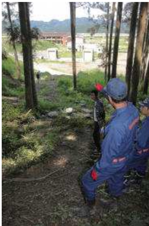
亡くなった児童の保護者らが「ここに避難させてほしかった」と訴える学校近くの山道。校舎(奥)から歩いて数分の距離

東日本大震災の津波で全校児童108人の7割に当たる74人が死亡、行方不明になった石巻市大川小の惨事から、間もなく半年がたつ。河北新報社の取材に応じた児童や住民らの証言で、当時は現場にスクールバスが待機していたことや、高台への避難を相談していた状況が浮かび上がった。学校管理下で児童が犠牲になった事例として戦後最悪とされる今回の被害は、避けられた可能性もあると指摘する関係者もいる。(藤田杏奴、野内貴史)